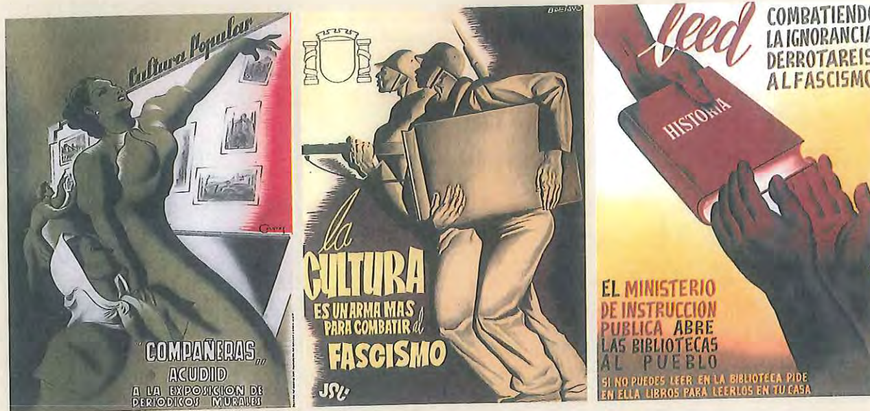
Na páxina anterior, unha moza lendo A Iliada . Sobre estas liñas, cartéis do tempo da II República e a Guerra Civil.

(CFABA). Conformaban, pois, un pequeno anaco da Administración do Estado ao que accedían tras superar unhas rigorosas e duras oposicións. É verdade que non todos saudaron a chegada da República e non viron con bos ollos os pulos innovadores. Algúns proviñan de escalas creadas moito tempo atrás —en 1936 aínda traballaban funcionarios que superaran as súas oposicións a finais do século XIX— e, en xeral, receaban de calquera tentativa modernizadora, apostando por manter un absurdo control social no acceso ás bibliotecas e aos arquivos. En realidade, vivían moi comodamente de portas cara a dentro, defenderon un sistema erudito e discriminatorio e asumiron un rol de elite copando os postos máis elevados na escala dos funcionarios. Antes e durante o período republicano foi normal velos militar en organizacións como a Unión Patriótica do xeneral golpista Miguel Primo de Rivera, Acción Española, Comución Tradicionalista ou Falange Española. Ao remate da Guerra Civil serán os responsábeis de delatar, investigar, depurar e propor sancións para aos seus ex-compañeiros.