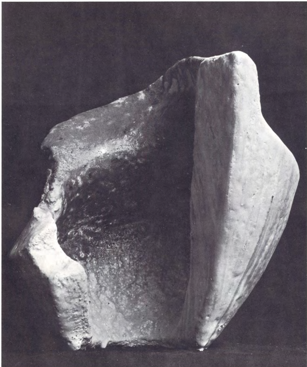
GRES ALTA TEMPERATURA 30 x 28 cms., pardos oscuros y claros