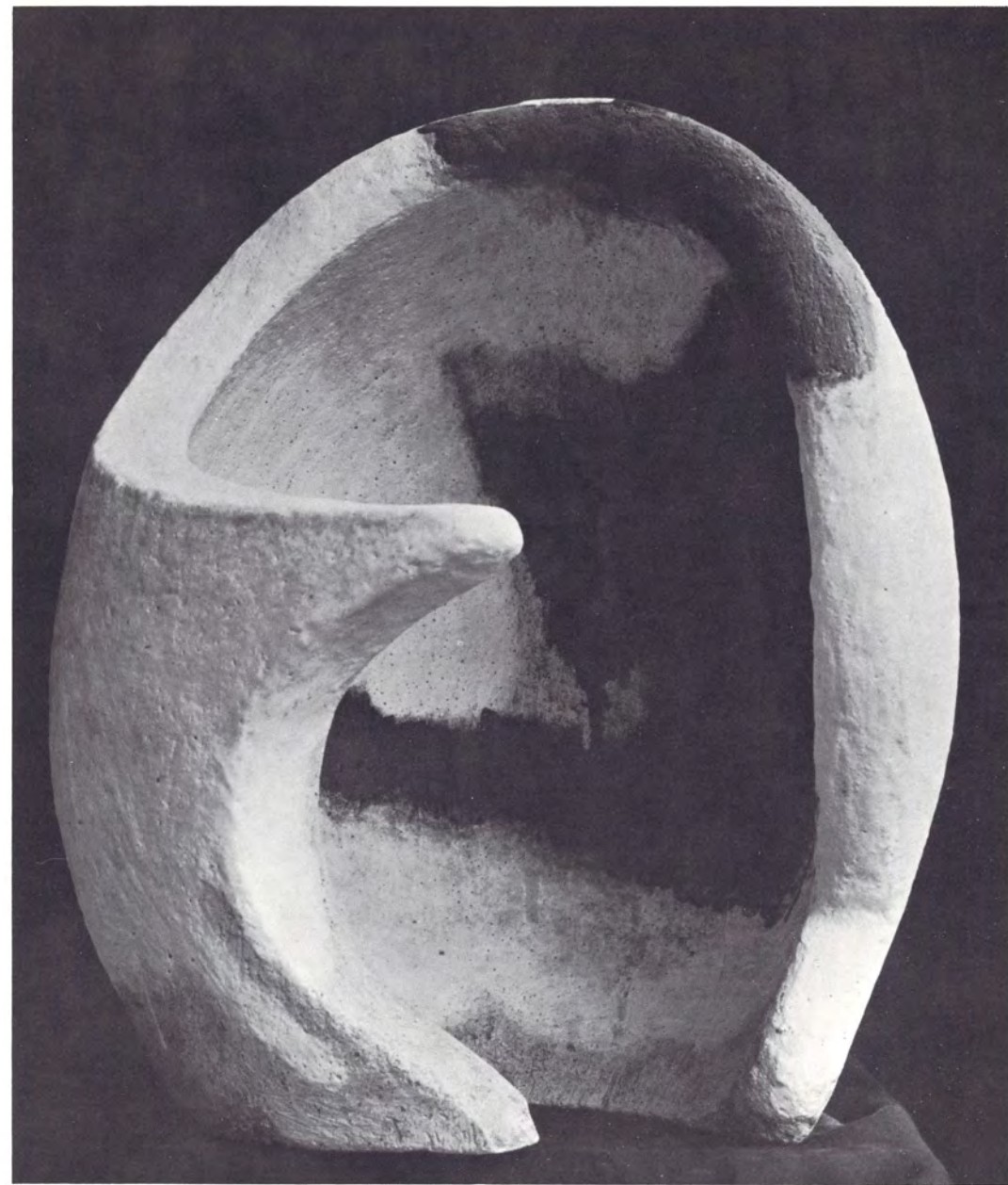
GRES ALTA TEMPERATURA 55 x 44 cms., blanco, negro, azul, ocre