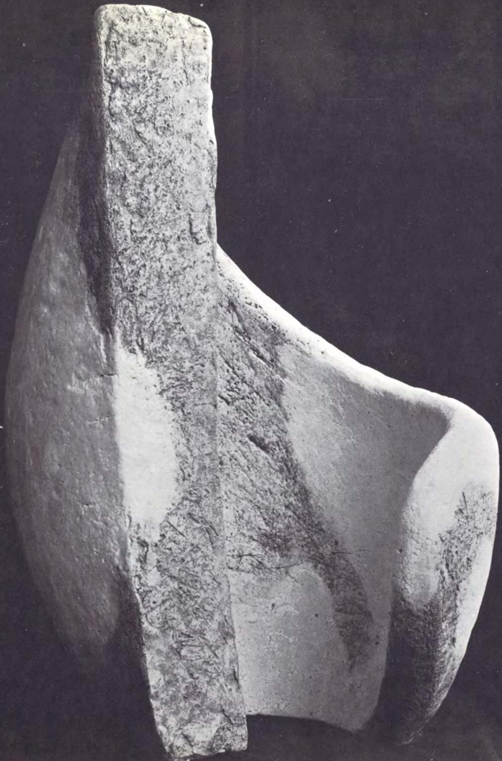
GRES ALTA TEMPERATURA 54 x 35 cms., pardos claros