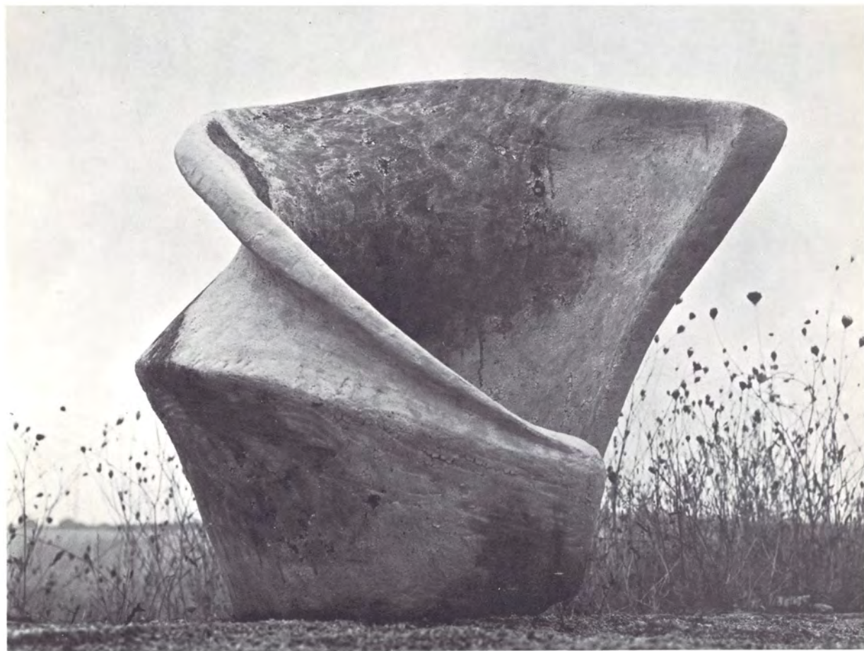
GRES ALTA TEMPERATURA 125 x 80 cms., blancos, azul, ocre, negro