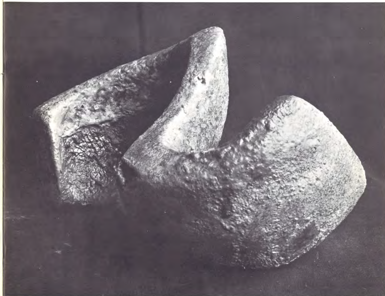
GRES ALTA TEMPERATURA 25 x 15 cms., pardos, amarillentos - negro