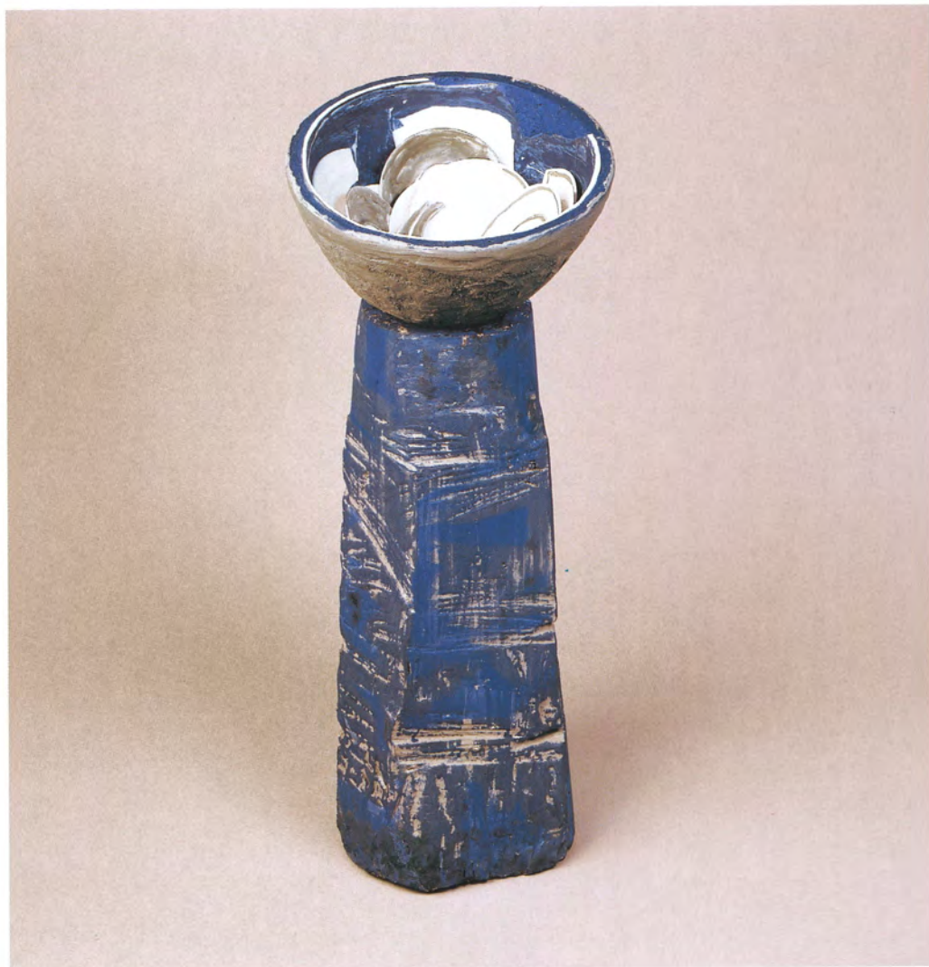
"Cuenco". Porcelana y madera. 73x29x28cms. 1993-97