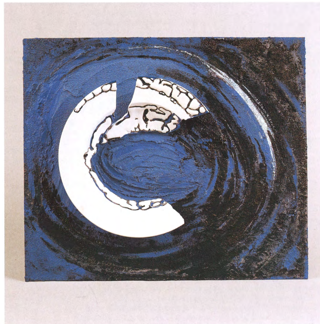
"Sugerencias" I. Porcelana y cemento. 31x37x8 cms. 1990-98