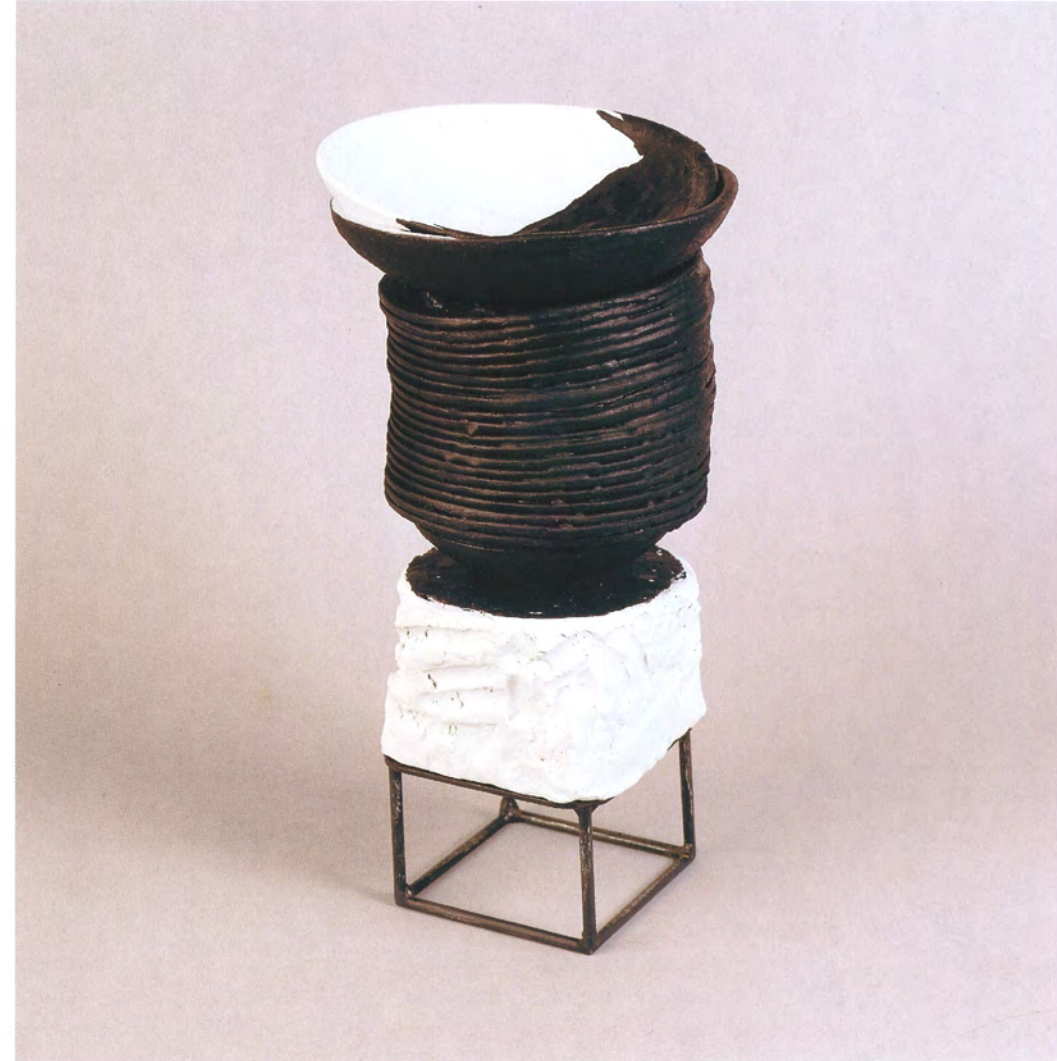
"Agrupación" 2. Porcelana y óxidos. 37x20x20 cms. 1995-97