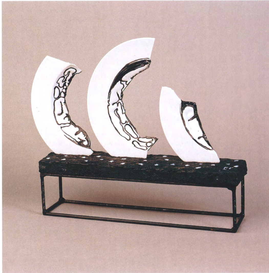
"Diálogos". Porcelana y óxidos. 32x40x8 cms. 1995-98