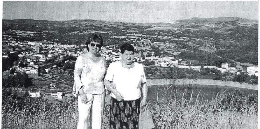
Vista panorámica dende Quintela, e un bonito primeiro plano ¿Coñécenas?

A matanza e o magosto e os turistas en agosto -É Quintela-