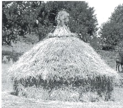
O palleiro que bonito velo neste tempo

A miña maneira de ver sodes pior que o lobo, porque botades un animal que mata por pracer, non para comer, só como din moitos, mentras hai animais vivos mata todos os que pode, logo come ata fartarse, e o resto queda por alí esparrado. Se isto non é un asesinato que veña Deus e o vexa, pero os asesinos máis grandes son os organismos que permiten e ordenan botulos, claro eles están a salvo nas súas oficiñas, coa calefacción e o aire posto e cobrando o que nós lles pagamos, que máis lles dá afundirmos económica e moralmente?