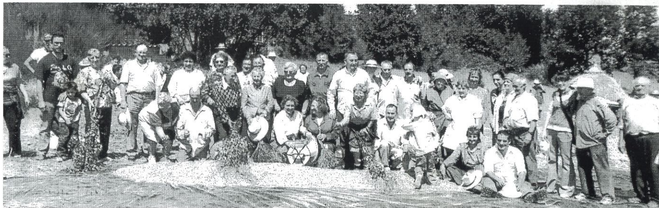
Quintela do Pando. Xuntouse o pobo enteiro para facer a malla e a seitura tal e como facían os nosos antergos. É como en tempos! Despois da xeira compartimos en harmonía comida, lembranzas e ledicia.