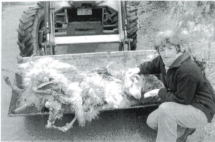
Unha door, ver asina os animalíños!!

Agora que ven a época das cubricións para os partos da navidade, que macho lles boto? Veñen os protectores do lobo a solucionar o problema, o vou a buscar sabe Deus a onde sementais, sen saber que problemas poden meter na explotación?, quen me quita a min o estrés que sinto cada vez que estando co rebaño se espantan as ovellas e empezo a suar e tremer pensando se será o lobo?, que calidade de vida me agarda si nos cercados que tanto esforzo me custou facer para poder ter algún día libre, agora non poden deixar o gando só?