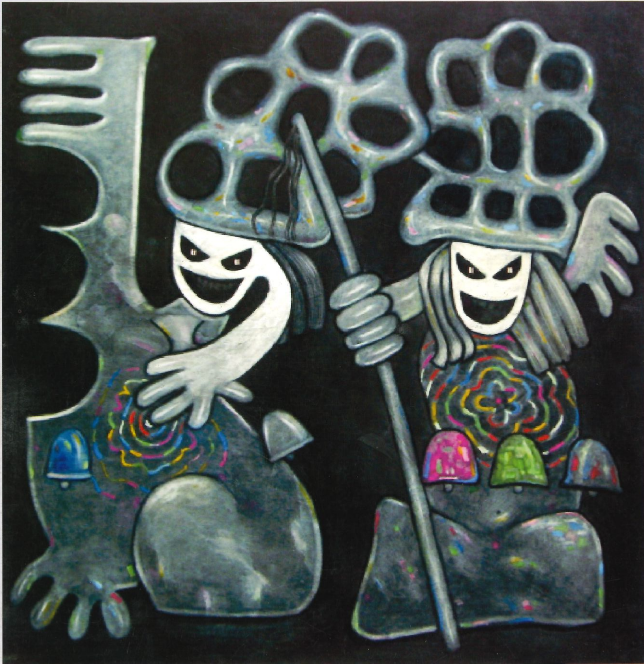
OS BOTEIROS DE PIQUICO