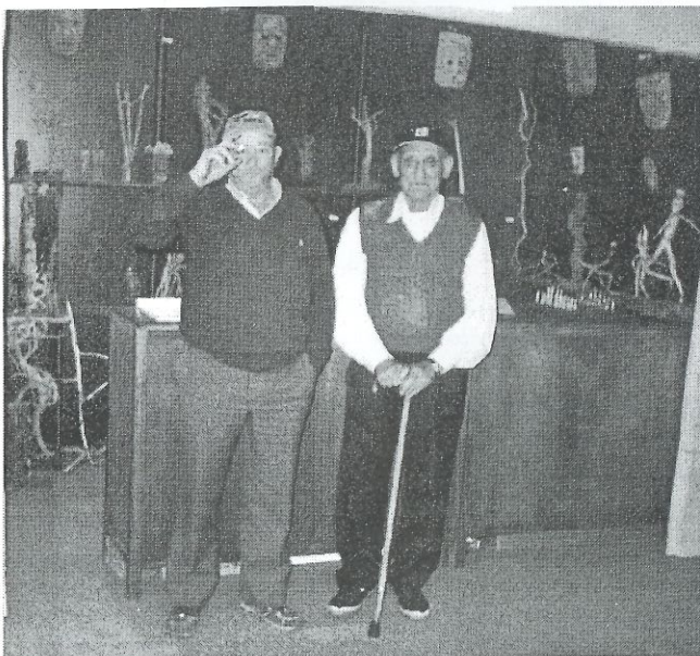
O meu pai, tamén era feliz co meu traballo