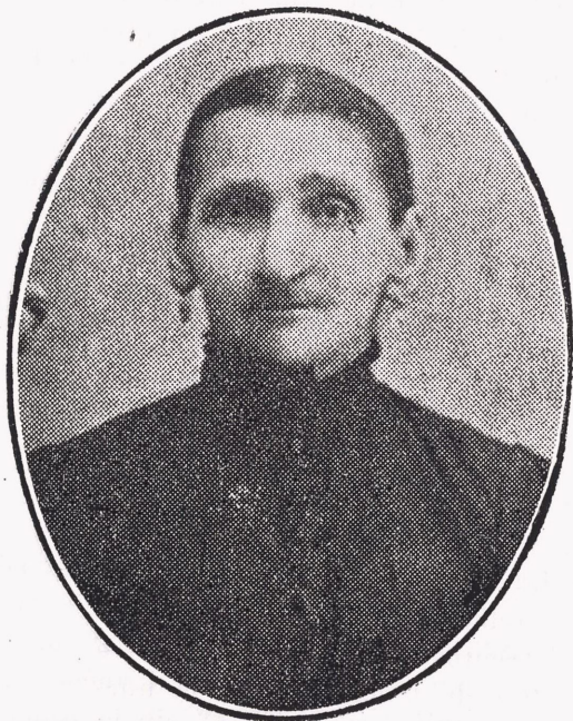
Rendida por una penosa enfermedad, que le ha obligado a guardar cama por