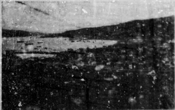
MARIN. — Vista general.

Piense —no dudo que otros pensarán otro tanto— y creo que la emoción poética excelsa se alcanza, en ciertas noches, cuando alguna voz, desolada, emite la estrofa; salvando, para los vándalos, perdidos en la sombra. Elantal de veces para ahuyentar las "meigas", que los cantos proliferan. Sino falta, al día, los poetas de este mundo gallego. Así sean Rosalía o Pedro Barzán, Curros o Cabanillas, Pardoal o Valle Inclán... (esta lista podríamos agregar a esta lista somera, los nombres del P.