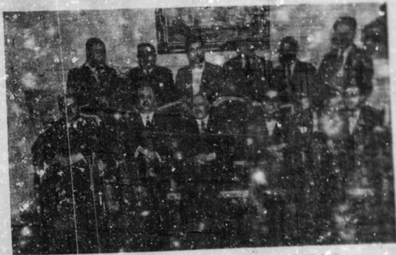
Personas que constituyeron la primera C. D. que rigió los destinos de Casa de Galicia.