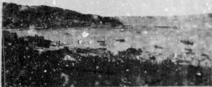
MARIN. — Vista del puerto.