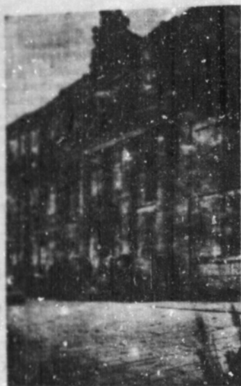
Vista de la fachada de la antigua Universidad de Santiago de Compostela.