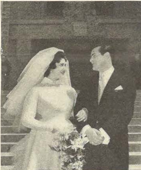
Los novios, después del enlace.