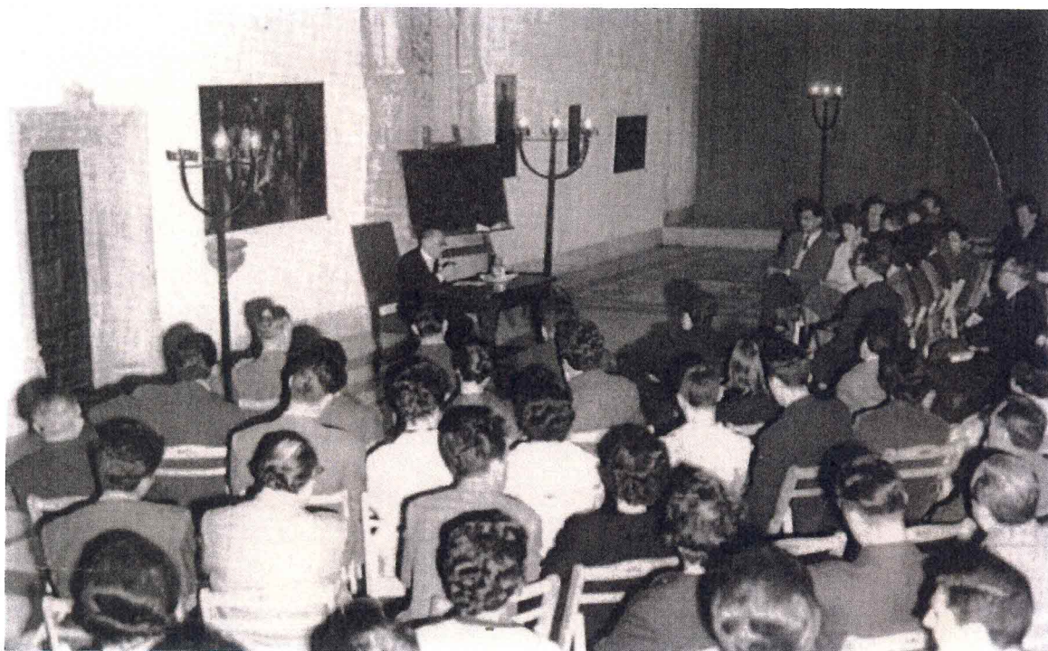
Palestra de Vicente Risco no Hostal dos Reis Católicos coa que O Galo arrancou as súas actividades. Santiago de Compostela, 1961. Fotografía publicada no libro Un canto e unha luz na noite. Asociacionismo cultural en Galicia (1961-1975)

súas moradas integráranse nas asociacións de cadansúas cidades e sobor de todo no Facho e na Asociación Cultural de Vigo.