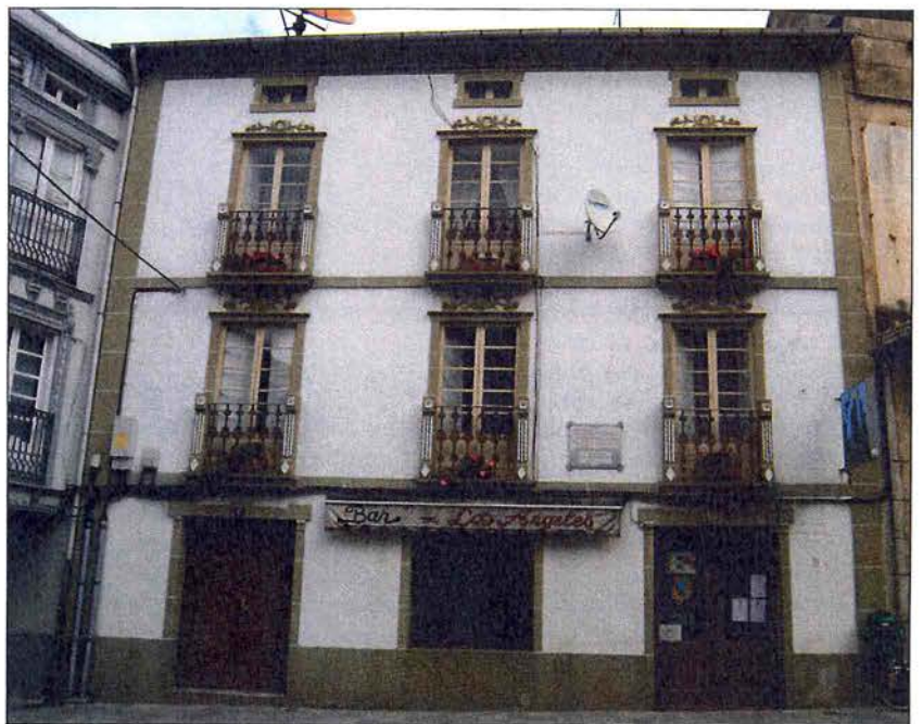
Casa natal de Francisco Fernández del Riego, no concello lucense de Lourenzá.

En xullo de 2000 colocouse na praza de Francisco Fernández del Riego, na cida-