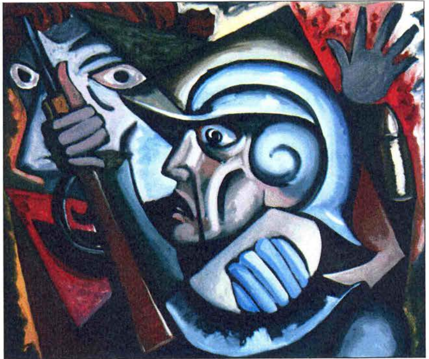
Ares ou a guerra , obra de Eduardo Fernández Rivas.

Ten obra no Centro Galego de Arte Contemporánea de Galicia; no Concello, na Deputación e no Palacio de Congresos da Coruña e na Colección Anuart de Barcelona, entre outras institucións públicas.