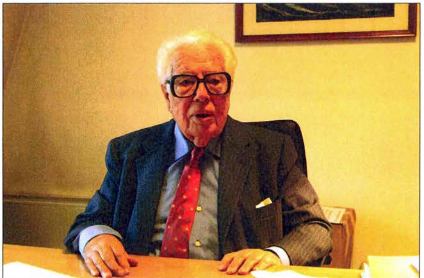
Francisco Fernández del Riego no seu despacho da Fundación Penzol, en Vigo (Pontevedra).