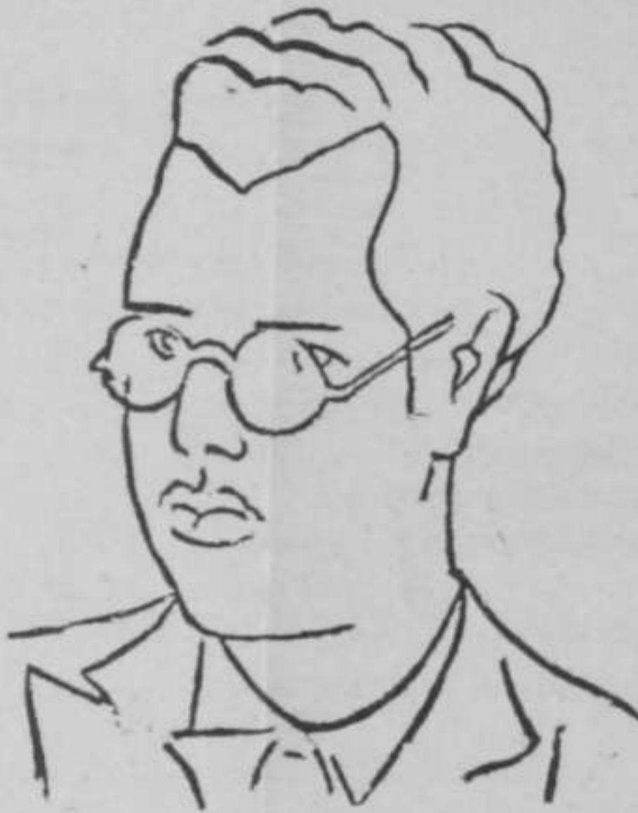
(DIBUXO DE MASIDE)

Cecais por vez primeira a mocidade descoñecida ocupa unha tribúa que consagra-ron figuras insíñes da nosa cultura. Però eu debo decirvos que ao vir a ela, pra colaborar n-ista xeira de conferencias tan felizmente iniciada non o faigo cun dereito que a erudición e a experiencia me houbesen dictado, sinón coa forza do sopro instintivo que respalda o temperamento e a intuición dun mozo universitario da Galicia nova, disposto a deixar ouvir a súa voz trémula, despois das lucubracións sosegadas e fondas dos conferenciantes que por aquí desfiaron. Veño a falarvos d-un tema amprísimo, e quero chamarvos a atención e previrvos contra d-algún posible prexuício: eu non veño eíquí con unha laboura de crítica, sinón con unhos breves comentarios, con un noticieiro informativo, que me impoñen necesariamente a miña cativa capacidade centífica e a desproporción do tempo en relación coa amplitude do asunto. Eu pretendendo desenrolar n-ista noite un «Índice cultural e artístico do renacemento galego» e penso que a mesma forza apostólica do Tema, cubrirá a moitidume de deficiencias que inevitablemente terán de se producir ao longo d-ele. Velehí como n-iste filmófono que vai a