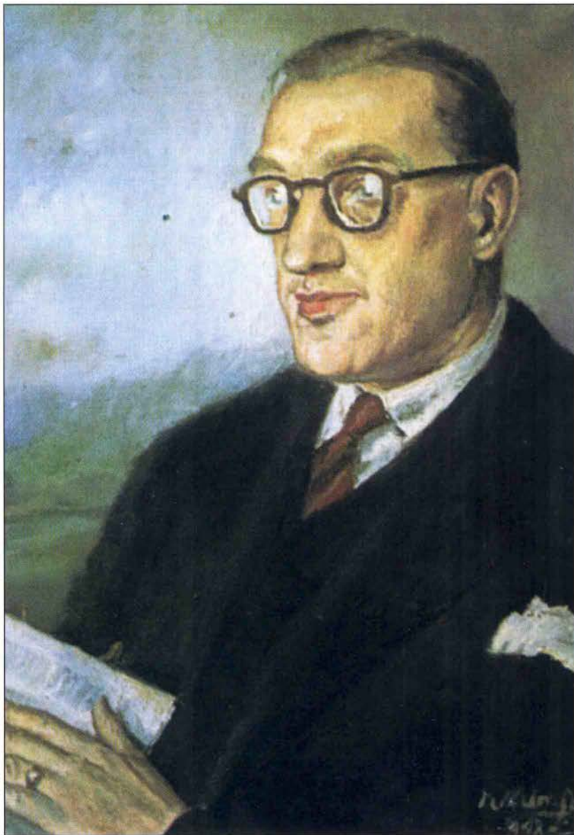
Retrato de Fermín Bouza-Brey, óleo de Rafael Alonso.

No campo da arte efectuou diversas investigacións sobre o prerrománico galego, así como sobre o románico e o barroco. Puxo especial interese no estudo da ima-