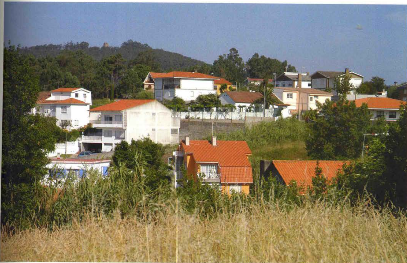
O lugar da Bouza Vella, na parroquia de Panxón (San Xoán), no concello pontevedrés de Nigrán.

Bouza-Brey pode ser considerado como o xefe da poesía neotrobadoresca; as aproximacións escasas e tímidas á técnica e ó espírito dos cancioneros medievais galego-portugueses que levaron a cabo algúns escritores anteriores a el non anulan o feito de que el foi o primeiro que, dunha maneira sistemática, procurou en parte da súa obra poética beneficiar, sen caer nunha imitación arqueolóxica servil, os achados da poesía galega medieval e especialmente a cantiga de amigo. O paralelismo, o leixapré, o refrán, certas particularidades do léxico que caracterizan a poética dos nosos trobadores aparecen en Bouza-Brey, aínda que adaptados libremente ás condicións do tempo no que escribe o poeta. A poesía deste autor caracterízase, ademais, pola riqueza e selección do seu vocabulario, pola atención que lle presta á eufonía das palabras e dos versos, pola amplitude e polo coidado da melodía. Rara vez se afasta da regularidade métrica. A construción sólida do verso pode evoca-la técnica parnasiana, mentres que a frecuencia do simbolismo e a importancia concedida ó