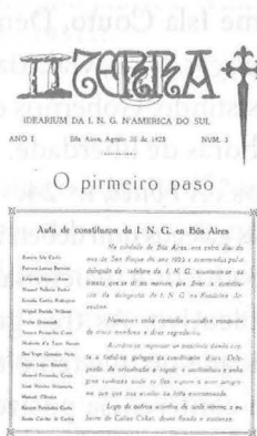
1923 Acto de constitución da ING en Bos Aires. Revista Terra 3