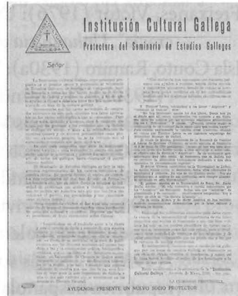
1925 Folleto da Institución Cultural Gallega. Protectora del Seminario de Estudios Gallegos. Bos Aires. Arquivo FIC