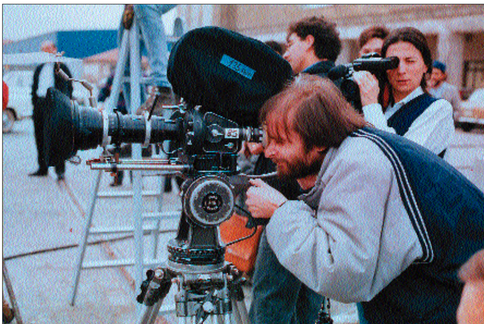
Durante a rodaxe de Sempre Xonxa no porto de Vigo.